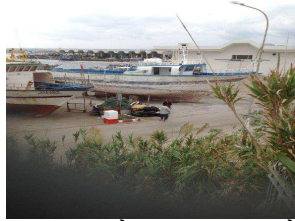
የሚያጓዙበት መርከብ ዓይነት ነው።

አብዛኛዎቹ የኤርትራ ወጣቶች ሃገራቸውን ለቀው በሱዳን አድርገው በሰሃራ በርሃ አቆርጠው ሊቢያ ከደረሱ በኋላ በመርከብ ወደ ኢጣሊያን ላምባዳሳ ይጓዛሉ። ይህ አስከፊና አደገኛ የሆነ ጉዞ ለብዙ ወጣቶች ሕይወት መቀጠፍ ምክንያት ሆኗል። በአሁኑ ወቅት በሜዲትራንያን ባሕር ውስጥ በሚደርሰው አደጋ ከሚሞቱት ስደተኞች ውስጥ የኤርትራውያን ቁጥር ከፍተኛ ነው። በዚህ አስቃቂ ጉዞ የሚሳተፉት ኤርትራውያን ብቻ አይደሉም። ኢትዮጵያውያን፣ ሶማሊዎች ፣ ሶርያውያን፣ ግብጾችና ሌሎችም የአፍሪካ ሃገሮች ዜጎች ይጓዛሉ።