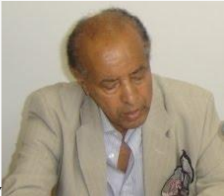
Aleme Eshete .”

ማንበብ ጠቃሚ ነው። ከላይ ያለው ፎቶ ትልቁ ኢትዮጵያዊ ው ሊቅ ፕሮፌሰር አለሜ