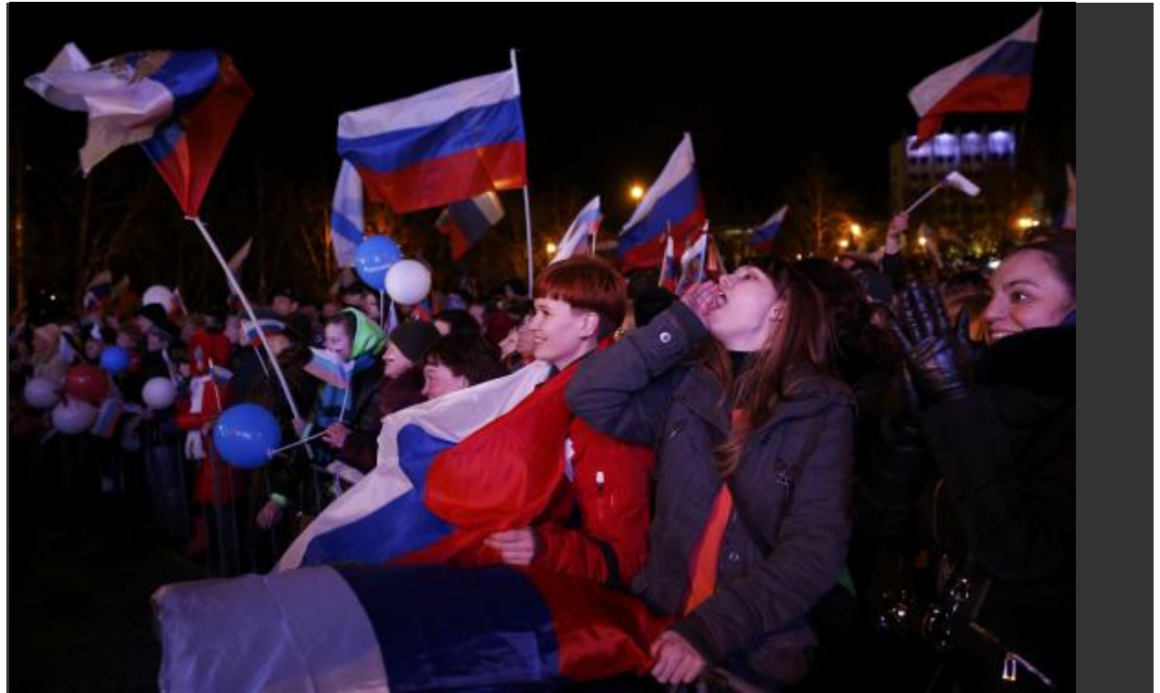
ክራሚያውያን ከሩሲያ ጋር መልሶ ለመቀላቀል ከ 90 በመቶ በላይ በሆነ ድምጽ ፍላጎታቸውን ገልጸው ደስታቸውን ሲገልጹ ) Mike Collett-White and Ronald Popeski SIMFEROPOL/KIEV Sun Mar 16, 2014 (Reuters) – Russian)

ቀደም ሲል በምዕራቡ ዓለም ፖለቲካ ተንታኞች ክራሚያዎች ወደ ራሽያ መዋሀድን አይፈልጉም፤ ፍላጎታቸው ከሌላው አውሮፓ ጋር ይበልጥ መተሳሰር ነው። በማለት ደግመው ደጋግመው ይናገሩ ወይም ያስተጋቡ እንጂ በማርች 2014 ሬፈረንደም ሲካሄድ ግን 97% የሆነው ህዝብ ነበር ዩክሬንን ትቶ ወደ ራሽያ መቀላቀልን የመረጠው። ይህ ሁኔታ የክራሚያ ተወላጆች ከሩሲያ ጋር ለረጅም ዘመናት ከነበራቸው የታሪክ፣ የፖለቲካ፣ የቤተሰብ፣ የባህል፣ የስነ ልቦናና የማሕበራዊ ግንኙነት ሙሉ በሙሉ መለያየት ችለናል፤ በራሽያና በክራሚያዎች መካከል የነበረውን የአንድነትና የትስስር ስሜት አጥፍተዋል፤ ብለው ሲያስቡ ለነበሩ ሁሉ መርዶና የራስ ምታት ነው የሆነባቸው።