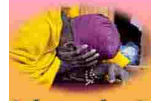
የጸሎት እና የምስጋና ጥሪ

ከብር ያለ ግብሩ እየተራቀቀ፤ ‘ጅቡ’ ተደላድሎ ሕዝብ እየበጨቀ፤ በዓለም አደባባይ እየፈነደቀ፤ ሕዝብ አገር ጠፍንጎ እየደቀደቀ፤ አንገቱን ሲያቀና አፉን እያረቀ፤ ኢትዮጵያዊ ምትሃት አንደበት ባረቀ፤ ከውስጥ ከትይዩ መልዕክቱ የላቀ፤ በመንፈስ የጸና ዓለምን ያስናቀ፤ አንድ አበበ ገላው ቁሞ ሰነደቀ፤ የሰማኒያ ሚሊዮን ቁጭት ጨቀጨቀ፤ ጮሌውን አደንዛዥ መርፌው የረቀቀ፤ የዓለም ‘መወጋጊያ’ የበላይ ዘለቀ።