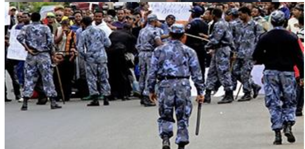
የኢትዮጵያና የሕዝቧ አምላክ የእጃቸውን በእጥፍ ይስጣቸዋል !!!