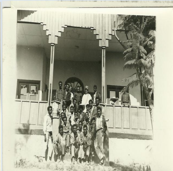
አምቦ ቀ.ኃ.ሥ. ማእረግ ሕይወት ሁለተኛ ደረጃ ት/ቤት አንዳረፍን

አምቦ ስንደርሰ እንደገና መፋጠጥ ሆነ። ወደ አዲስ አበባ ብሎም ወደ ወሊሶ ልንሳፈርበት የሚያስችለን ገንዘብ አልነበረንም። መምህር ሲራክና እኔ እንደገና ፈተና ላይ ወደቅን። መሳፈሪያ ገንዘብ እንድናፈላልግላቸው ጓደኞቻችን ወጥረው ያዙን። አንድ ብልሃት አገኘን... የማታ ማታ። የማእረግ ሕይወት 2ኛ ደረጃንና የአምቦ እርሻ ኮሌጅ መምህራንን እርዳታ መጠየቅ። አዎን ሠራ። የሚቻላቸውን ረድተውን ተሳፍረን ሄድን።