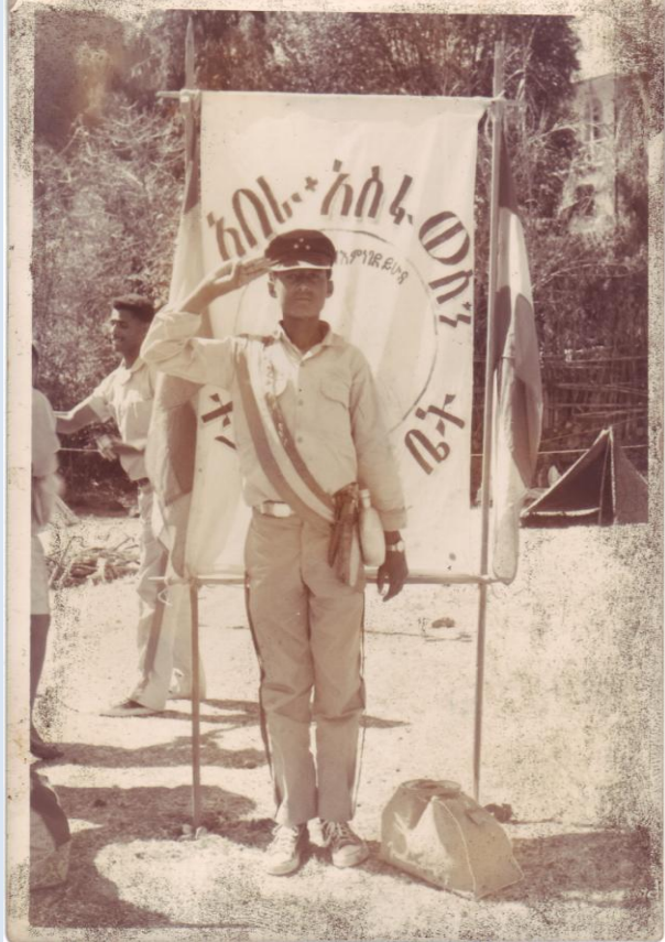
በ1960 ዓ.ም. ደብረ ሊባኖስ ተጉዞን በነበረበት ጊዜ ለመታሰቢያ የተነሳሁት

የቦይ እስካውት አለባበስ ደስ የሚል ነው። ባብዛኛው እጅ ጉርድ የካኪ ሸሚዝ ከቁምጣ ጋር ይለበሳል። አንዳንዶቻችን እጅ ሙሉ የካኪ ሸሚዝ ከባላሌ ሱሪ ጋርም እንለብስ ነበር። በሱሪው ላይ ቁልቁል የሚወርድም በቀጭኑ የኢትዮጵያ ባንዲራ በእስፐርል እናያይዝ ነበር። በደረታችን ላይ ደሞ ትንሽ ሰፋ ያለ ያገራችንን ባንዲራ እናገለጽም ነበር ። አንገት ላይ ሸብ የምትደረገዋ እስካርፍም ከቦይ እስካውት ኮፍያ ጋር ተስማምታ ስትታይ፤ የመታምርና የምታጓጓ ነበረች። የዚህችን ዓይነት ኮፍያ ማግኘት ካልተቻለ፤ የካውያ ቅርጽ ያለው ኮፍያ ወይም የሰሌን ባርኔጣም ስንጠቀም ነበር። ጨቤ ከነአፎቱ፤ ኮዳና በልዩ የተቋጨ ገመድ እንን ላይ መታጠቅም ደምብ ነው።