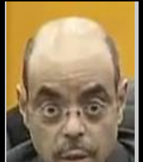
ለዘላለም በጨለማ ውስጥ!!